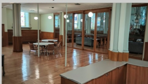
Salle du Clocher

Si vous souhaitez louer la salle, veuillez contacter Danielle Clément. 450-347-1680